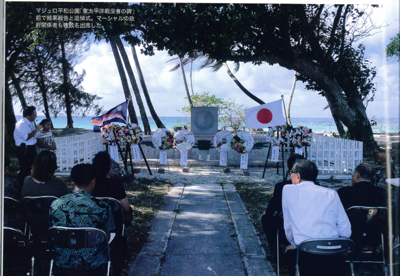
マジュロ平和公園「東太平洋戦没者の碑」前で結果報告と追悼式。マーシャルの政府関係者も複数名出席した。