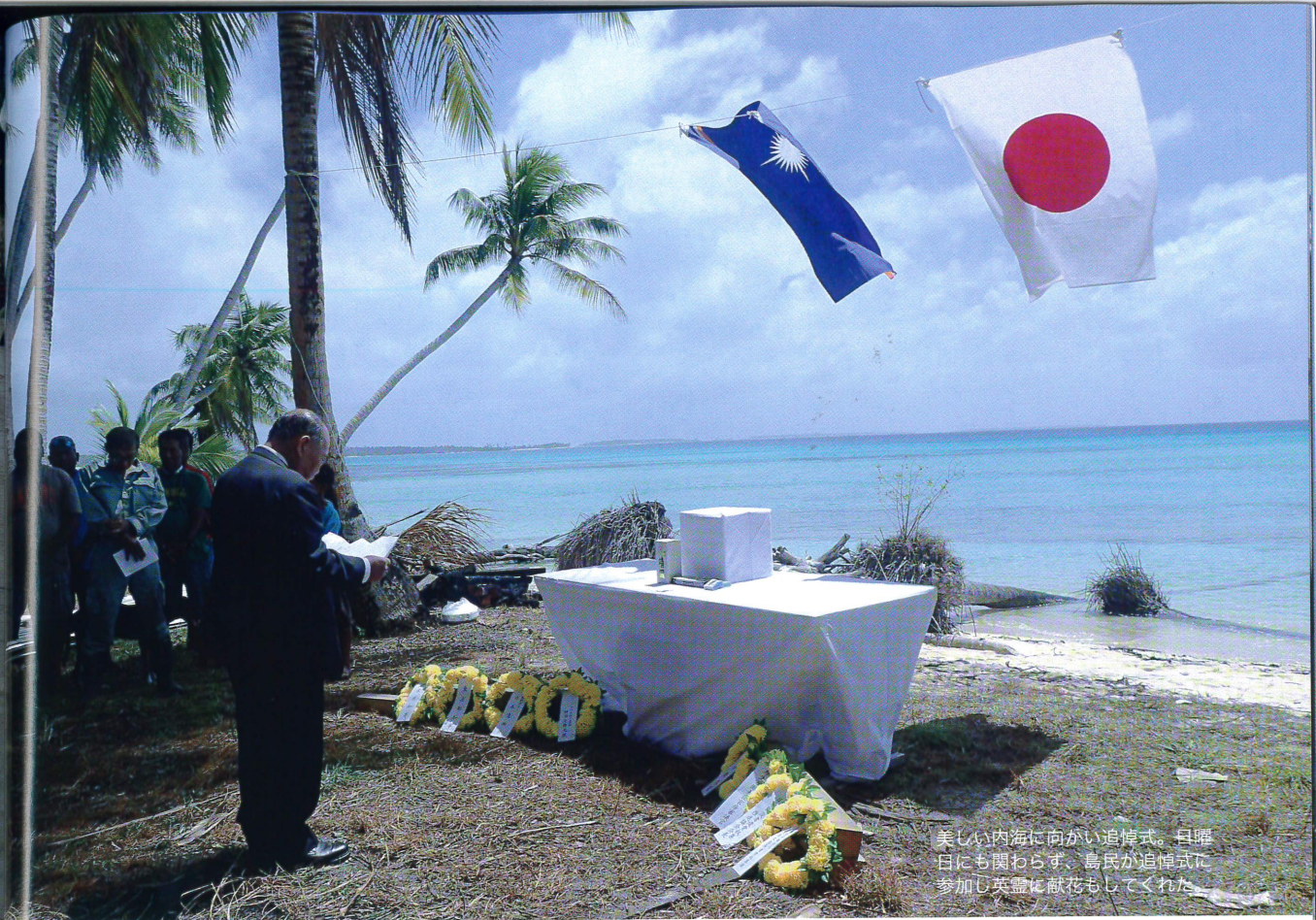
美しい内海に向かい追悼式。昇降日にも関わらず、島民が追悼式に参加し英霊に献花もしてくれた。