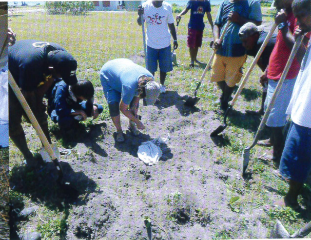
収容場所には必ずHPO（歴史保存局）の学者（アメリカ人女性）が同行し、遺骨をチェックする。