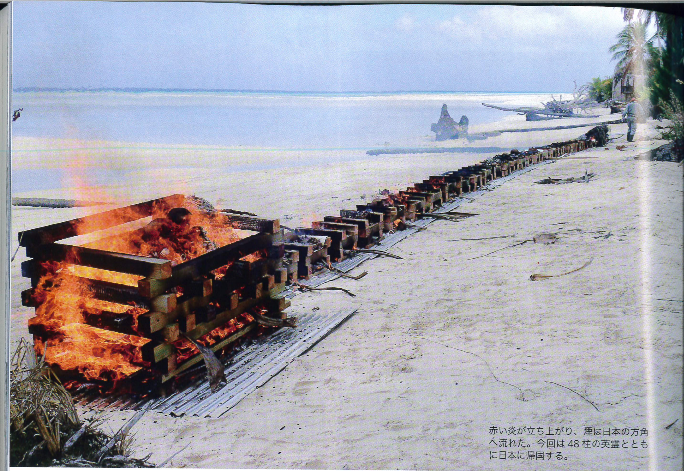
赤い炎が立ち上がり、煙は日本の方角へ流れた。今回は48柱の英霊とともに日本に帰国する。