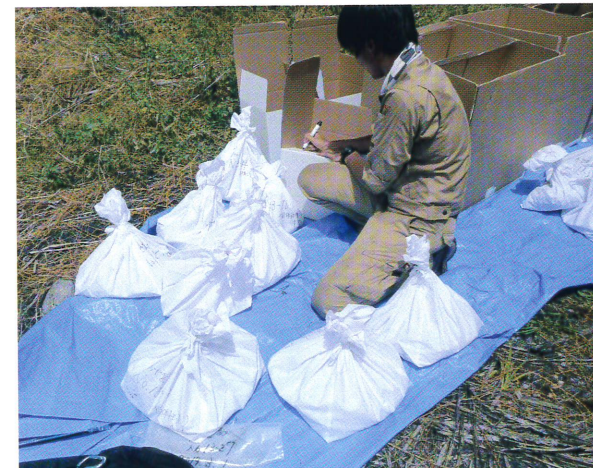
焼骨を終え、清潔な白袋に一人分ずつ遺骨を入れて、専用箱に封入。炎天下での過酷な作業。