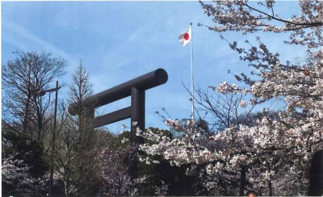
靖國神社の鳥居と桜

●発行日: 令和4年8月1日 ●発行人: 高林芳夫 ●本部: 181-0012 東京都三鷹市上連雀8-7-8 ●電話 & FAX: 0422-77-8557 ●編集人: 鈴木千春