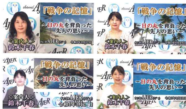
チャンネルAJER(アジャ)「戦争の記憶」

媒体名 「チャンネルAJER(アジャ)」 番組名 「戦争の記憶」 ※「マーシャル戦」「ウオツゼ遺骨収容レポート」ほか、戦跡レポートをご紹介しています。