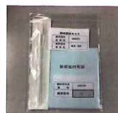
検体採取キット (ご遺族用)

※令和3年8月時点の状況。他の地域も戦没者遺骨の検体が採取され次第鑑定を実施します。