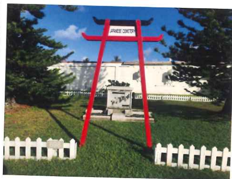
金子さんより届いた慰霊碑の写真（2022年1月）