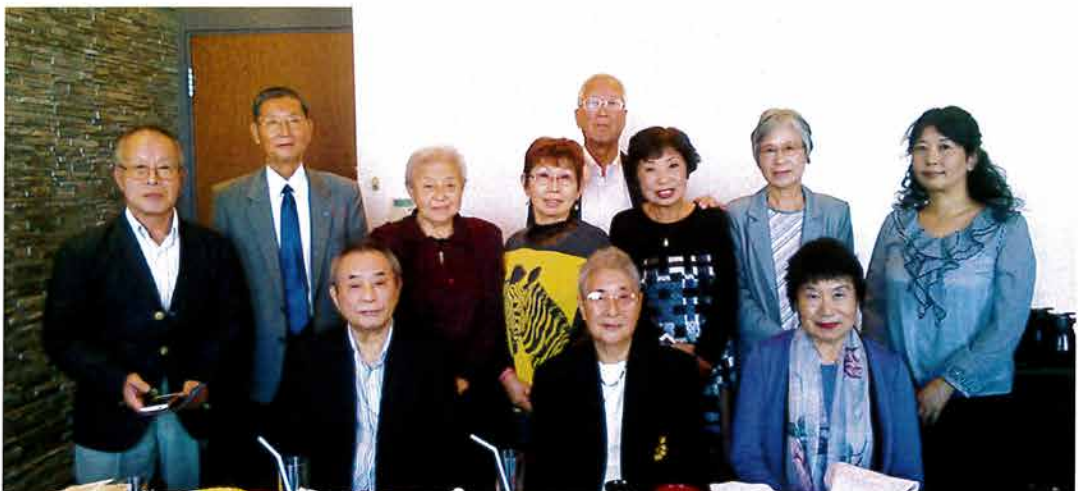
徳原さんを囲んで、再会を約束