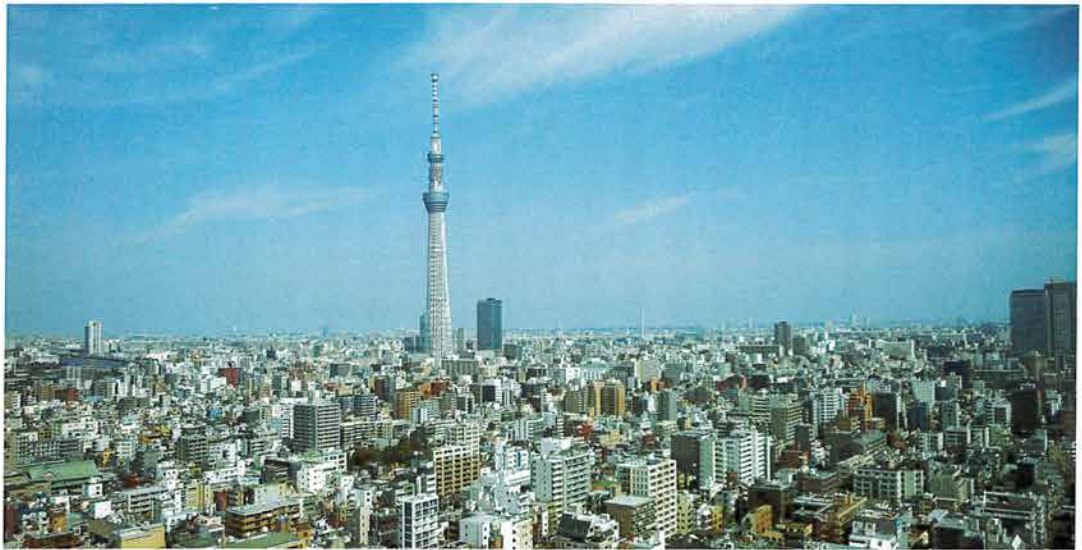
25階(最上階)からの眺め