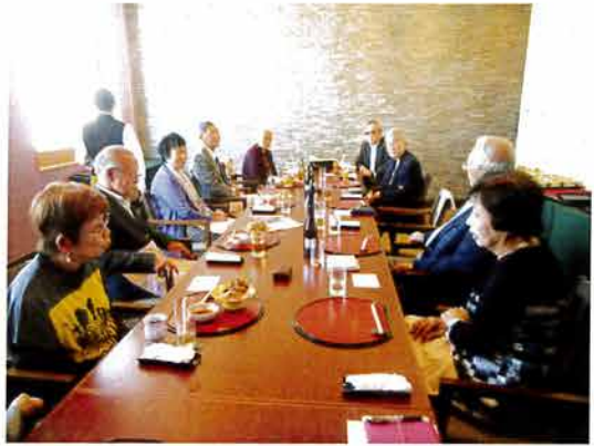
第一ホテル両国のレストランにて