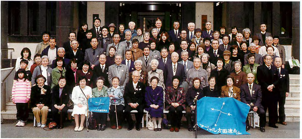
平成17年度慰霊祭参加者集合写真 (平成17・4)