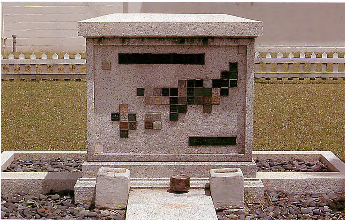
マーシャル方面遺族会クェゼリン島慰霊碑（平成16・10）